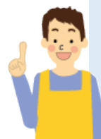
デイサービスセンター勤務 介護福祉士

「心の管理栄養士」という言葉が印象的でした。プラスの情報を共有する大切さを学び、利用者さんに対する見方が変わりました。一緒に楽しめる活動をしていきたいと思っています。