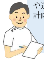
介護老人保健施設勤務 作業療法士

アクティビティ・ツールの活用でコミュニケーションが円滑になると感じました。「心が動けば身体が動く」を意識して、ご本人の自信や達成感につながる活動を計画したいと思います。